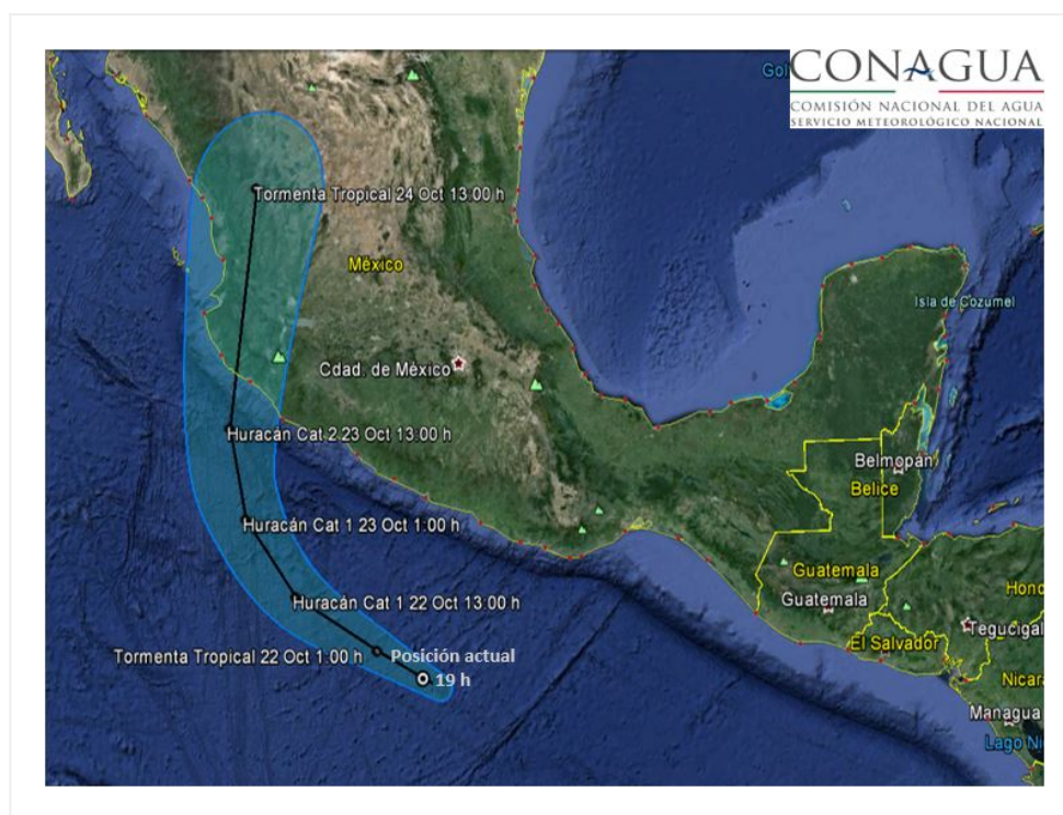
Trayectoria pronóstico de la Tormenta Tropical "PATRICIA"